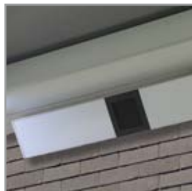
MUZIEK IN BEAM-MODULE