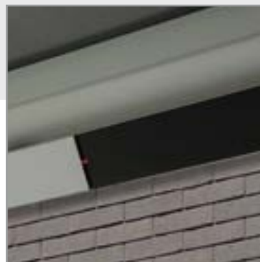
VERWARMING IN BEAM-MODULE